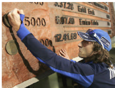
Enrico Fabris "stampa" il suo nome sul muro dei record

Si è presentato al mondo con un'impresa di quelle che restano nella storia olimpica, regalando due ori e un bronzo all'Italia ai Giochi torinesi. E ci ha preso gusto, il re del pattinaggio veloce: a Salt Lake City, prima tappa di coppa del Mondo, Enrico Fabris è risalito ieri sul tetto del mondo vincendo i 5000 metri con tanto di record: 6'7"40, otto centesimi meno dell'olandese Kramer. Anche questa impresa rimarrà negli annali.