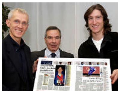
Enrico Fabris ha ricevuto ieri da Giorgio Viberti (s) e il direttore Giulio Anselmi (c) una riproduzione de La Stampa in ricordo dei due ori alle Olimpiadi di Torino 2006

Reduce dalla World Cup a Salt Lake City, dove ha stabilito il record assoluto dei 5 mila (poi superato), a Calgary, Enrico Fabris - biolimpionico del pattinaggio di velocità ai Giochi di Torino 2006 - è tornato nella città che lo rese famoso per ricevere una medaglia da La Stampa e la riproduzione delle pagine che ne celebrarono le imprese.